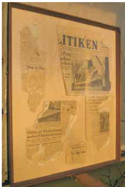
Billedcollage med udklip af Statsminister Staurings tale fra 1938