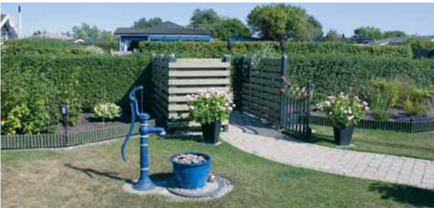
Så flot præsenterer forhaven sig, der vender ud mod Liljestien