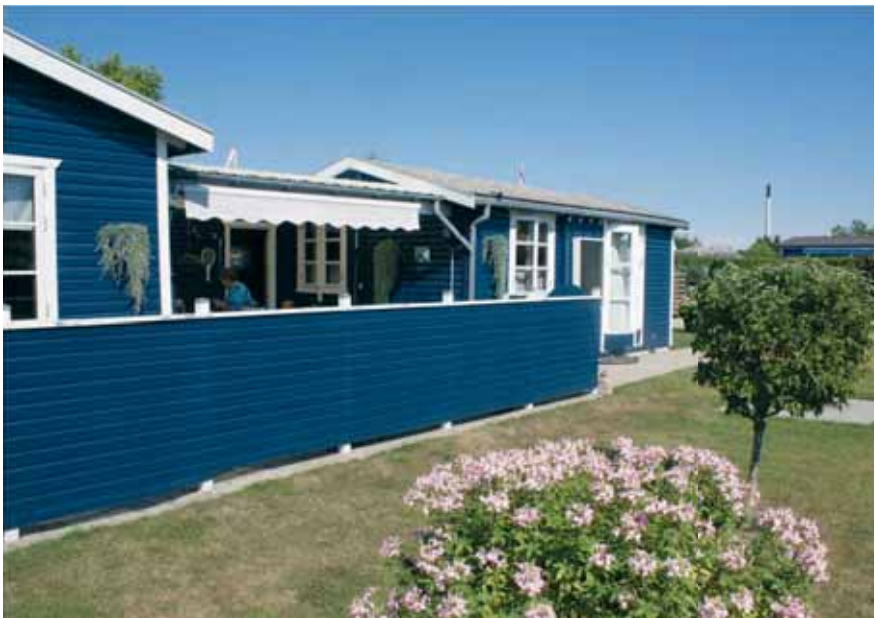
Det flotte blå hus der vender ud mod det grønne område