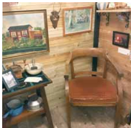
En del af udstillingen, med ting indsamlet fra et kolonihavehus. En lille pudsig historie er at billedet over kaffekanden er malet af en haveejer fra Sommerbyen, og det har hængt i selskabslokalerne på Statenegården