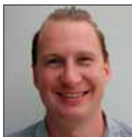
Klaus Storbank Parkeringspladser