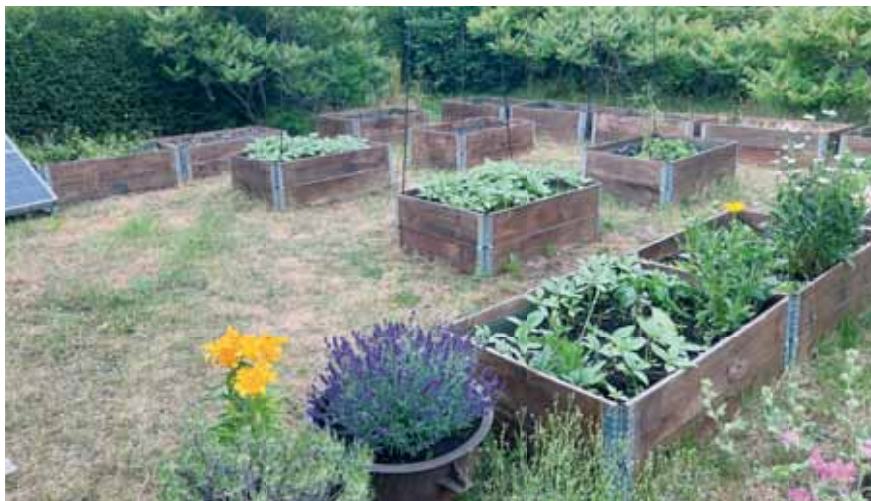
Et bevis på at der satses mere på at dyrke afgrøder end på prydhave

tage billeder, men hun ville ikke fotograferes. Hendes grund var på 6-700 m 2 , som vist nok var den største, til forskel fra de fleste andre haver, der lå på 4-500 m 2 . Fælleshåb består af 101 haver. Som den eneste forening, så er deres en andelsfor-