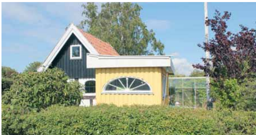
Et lille nydeligt hus og udhus med et imponerende vindue i Solvang

hurtigste færge er, at når man, som vi, blev ledt op på øverste bildæk, så resulterede det i at vores række af biler, var en ½ time om at komme fra borde, som de allersidste. For os der ikke er på arbejdsmarkedet mere, er det ikke det store problem, men for andre kan det være et stort irritationsmoment.