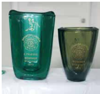
Her er et par eksempler fra pokalskabet i Sporten