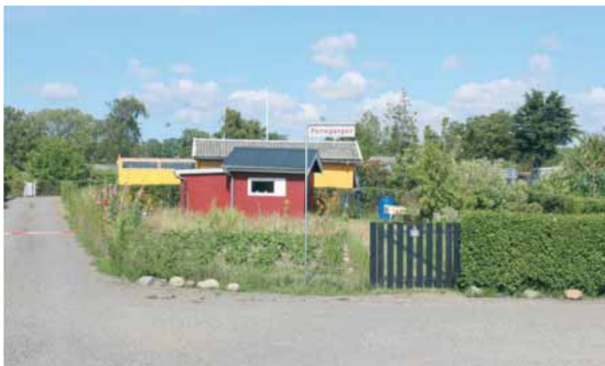
Et parti fra Solvangs haveforening