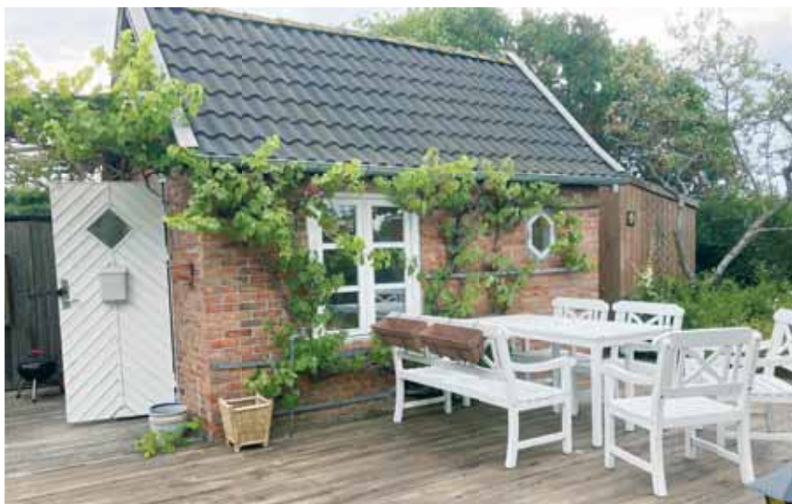
Et kært lille hus i H/F Fælleshåb

Hun havde boet i København, og havde arbejdet som fotograf, men pga. af corona-pandemien, så følte hun sig meget isoleret og flyttede derfor hjem til Bornholm.