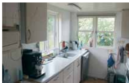
Et udsnit af køkkenet