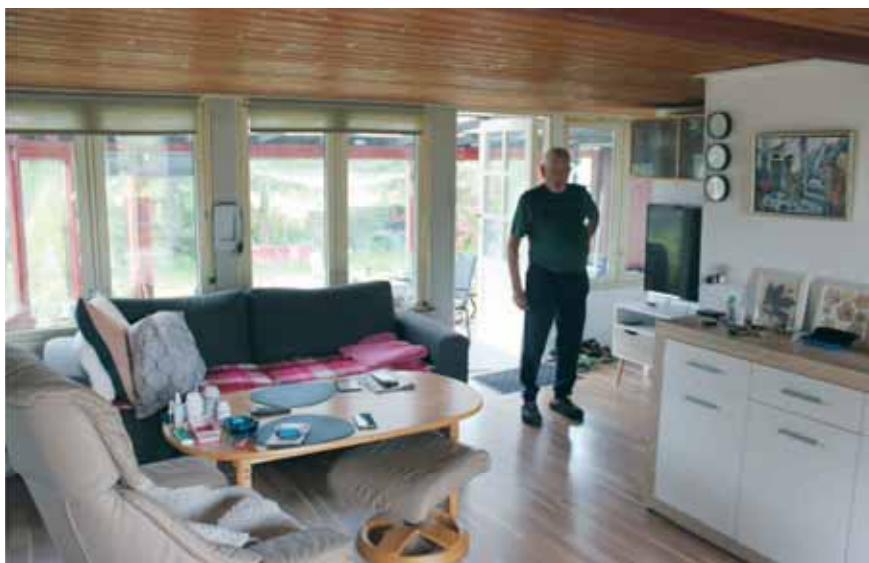
Egon i deres stue med udgang til udestuen

Sommerbyen, hvor vi har boet hver sommer fra maj til oktober, lige siden 1989.