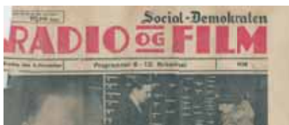
Social Demokraten fra 12/11 1938

For 4-5 år siden fjernede vi det gamle klædeskab i soveværelset, da vi skulle udvide rummet. Da vi rev væggen ned, så var der fyldt med rottelorte inde i væggen. Vi kontaktede rottefængereren. Han satte fælder op, men der var ingen der gik i fælden. Så smed han røgpatroner ned i rørene, med det resultat, at hele huset blev fyldt med røg. Der er noget galt sagde han. Det viste sig, at rotterne havde gnavet rørene over fra