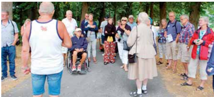
Ved ankomsten til Andelslandsbyen

hvor andelsperioden fra 1870-1950 kan opleves gennem adskillige udstillinger og aktiviteter. Eksempelvis findes et andelsmejeri, et husmandssted med dyr, en smedje, et savværk, et skomagerværksted, en kirke og en redningsstation. I andelslandsbyens gamle brugs var det muligt for besøgende at købe rygeost, nykærnet smør, spegesild, erstatningskaffe (richs), kurve, koste og meget andet.