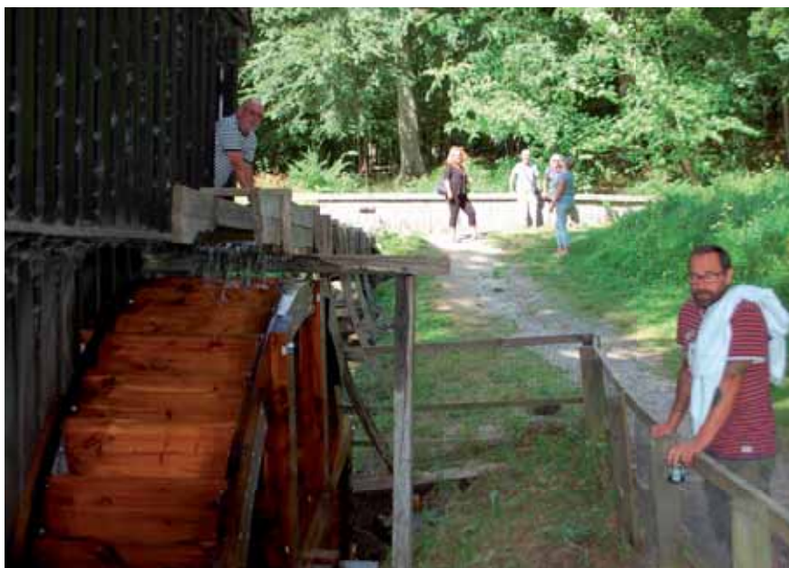
Besøg ved Tadre vandmølle