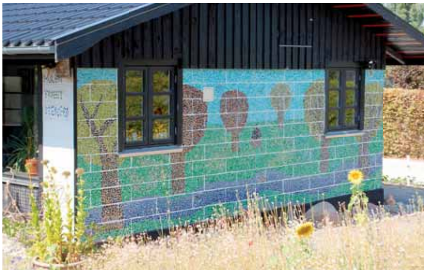
Den flot udsmykkede facade

Jeg har før boet i det gamle Ejby, hvor jeg havde et lille hus. På ture rundt i området så jeg også en på kolonihaver og tanken tiltalte mig. Efter jeg solgte huset boede jeg to år i