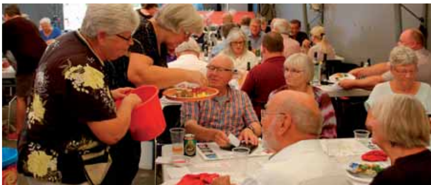
Festudvalget serverer både drikkevarer og sælger lodder