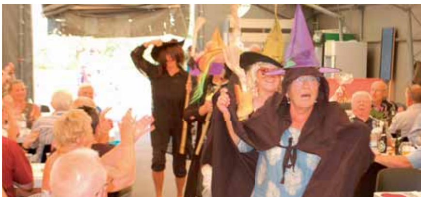
Festudvalget stod også for underholdningen, her er de udklædt som hekse