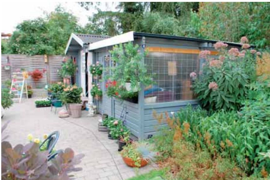
En af Ejbydals flotteste haver

møder op hver gang. Klipping af hækken ved P-pladsen betaler vi os fra.