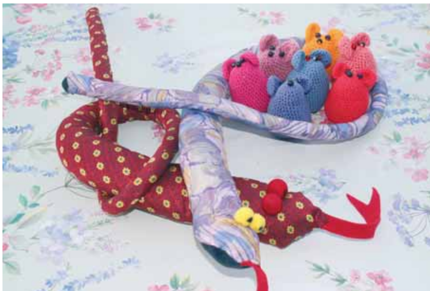
Et udpluk af hendes kreationer

En veninde af mig havde hus herude. På den måde fattede jeg kærlighed for