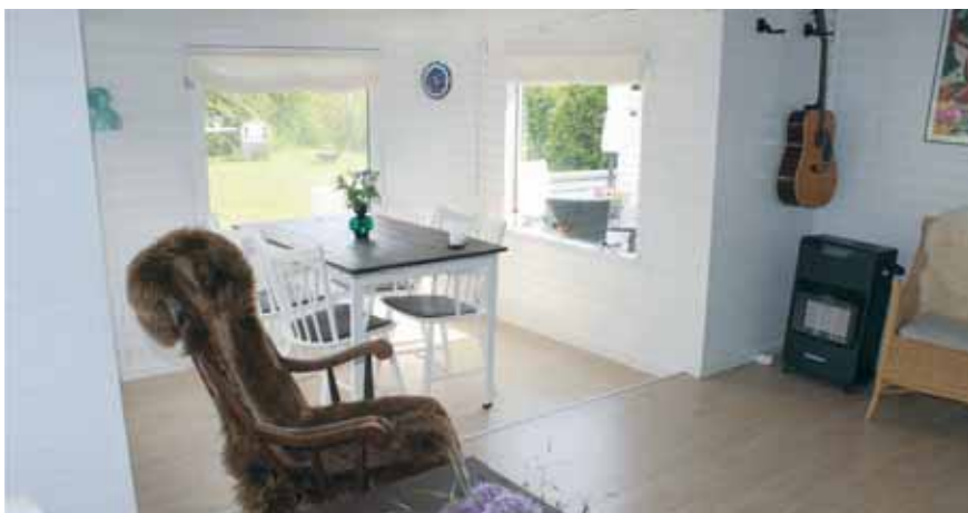
TV- og spisestue med gulv i 2 niveauer

sted med sol, et med skygge, når det bliver for varmt og ikke mindst skal der være et sted med læ.