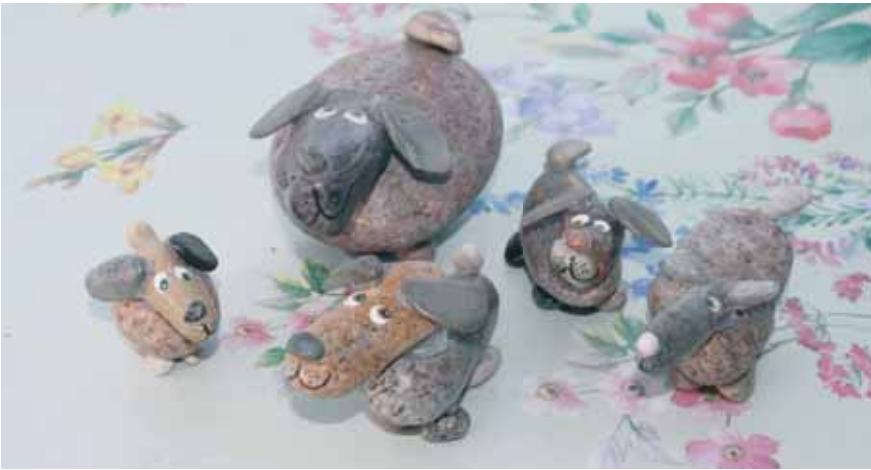
Fabeldyr, lavet af borhomlske sten