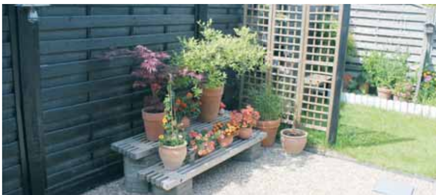
Baghaven med urtebed i baggrunden

Redaktøren med frue, sagde derefter tak for et par hyggelige timer.