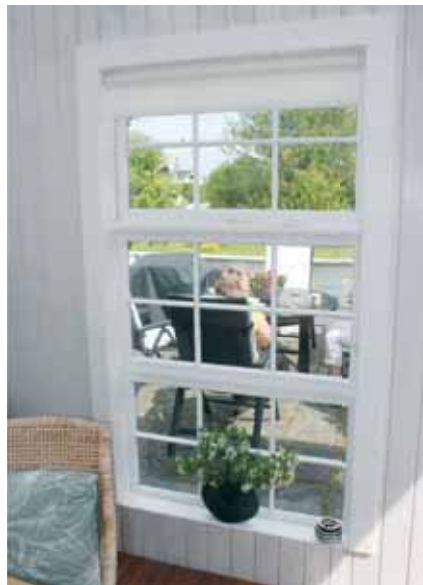
Vinduesparti, taget fra udestuen mod terrassen