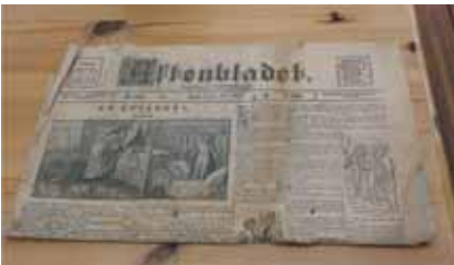
Aftenbladet fra den 6. november 1921, fundet under køkkengulvet

hyggekrege rundt omkring i haven, og alle steder er der siddepladser. Der skal være et