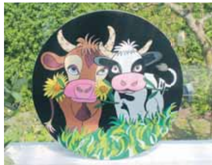
Et herligt maleri af to køer

Imidlertid viste det sig at han var meget tørstig. Tit skete det han sov over sig. Når der så kom folk for at bestille en bisættelse, så måtte jeg tage over. Til sidst var det stort set mig der stod for de fleste bisættelser.