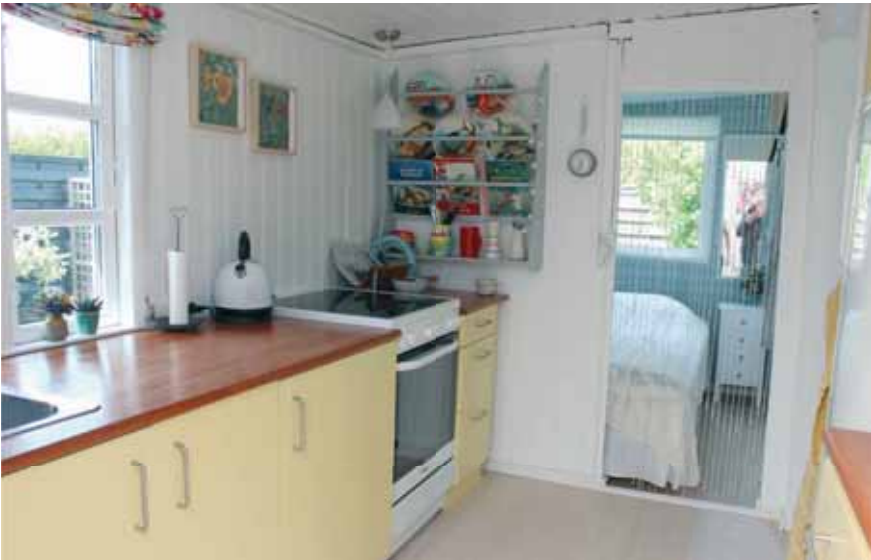
Det nyrenoverede køkken

Er huset godt nok isoleret til I kan tilbringe en weekend her i vinterhalvåret?