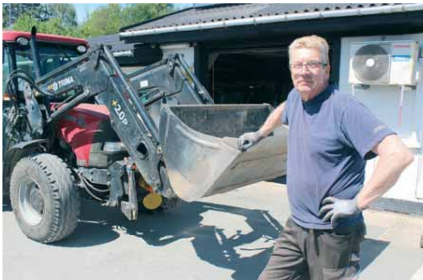
Fritz ved foreningens traktor