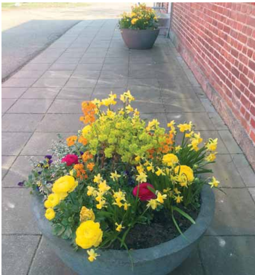
Sannes flotte kummer ved Statnegården