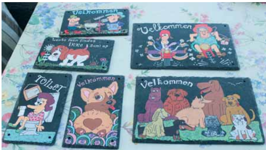
Nogle få af hendes mange "velkommen" skilte, malet på skifer