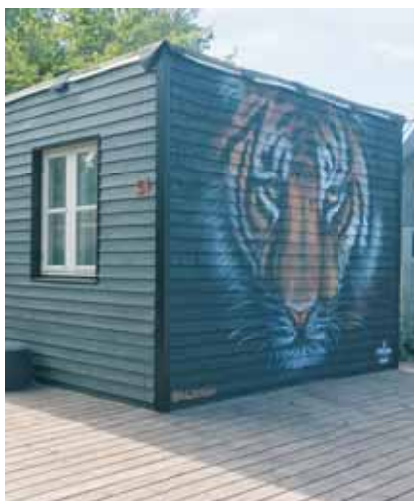
Dette hus er dekoreret med et tigerhoved

En anden bedrift er, at 6-7 medlemmer har gravet strøm ned til halvdelen af Fjordbyen uden at få noget for det – imponerende!