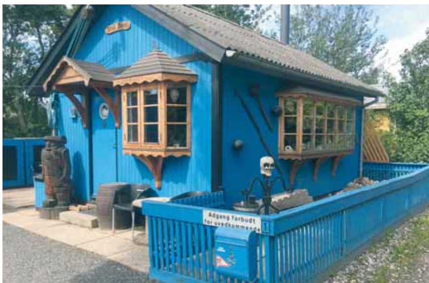
Husets ejer er en tidligere sømand, der oprindeligt kommer fra Ishøj på Vestegnen. Karnappen foran huset er lavet af en tømmerlærling til svendeprøve.