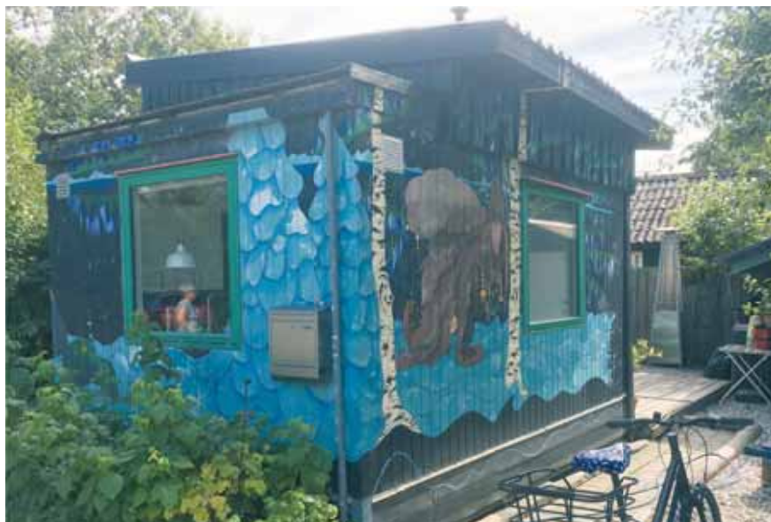
En del huse i Fjordbyen er malet med fantasifulde motiver

Det er der mange der gør. I det hele taget, så er folk her orienteret mod vandaktivitet. En del har en båd, andre har en kajak og andre igen et surfbræt.