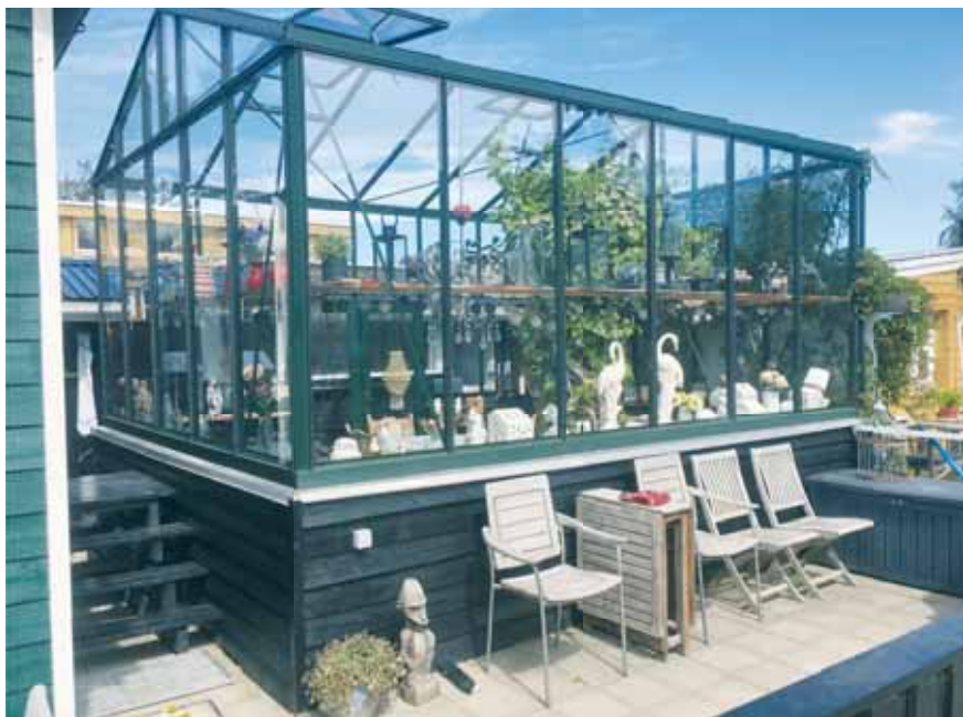
Dette drivhus/udestue vækker opsigt med den flotte udsmykning